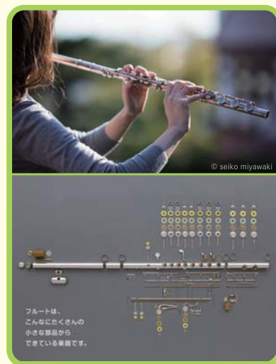
フルートは、 こんなにもたくさんの 小さな部品から できている楽器です。